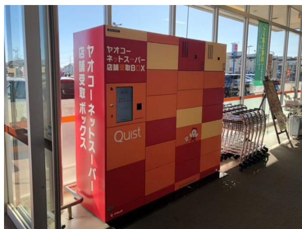
<ヤオコー西大宮店 様>