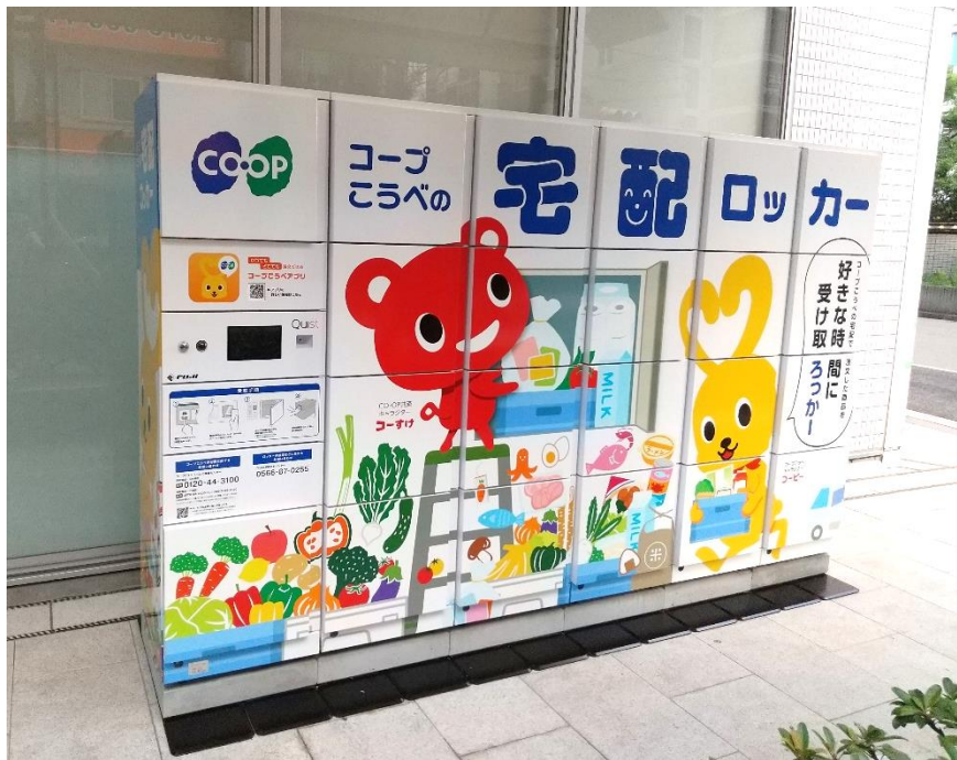
<コープこうべ 住吉事務所>

新たに導入された宅配ロッカーは、2022年10月よりサービス開始され、組合員が注文した宅配商品が、職員不在の時間に非対面で受け取り可能となります。