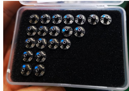
F U J I 製ノズルの模倣品

F U J I は、全てのお客様に自社製品を安心してご使用いただけるよう、今後も知的財産権の保護に注力し、模倣品の製造販売等の不法行為に対して断固たる姿勢で取り組んでまいります。