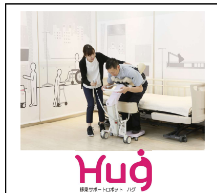
Huq 移乗サポートロボット ハク